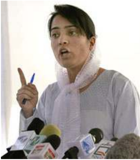
Malalai Joya, en una roda de premsa a Kabul el 21 de maig de 2007, promet continuar la seua lluita contra els senyors de la guerra.

Durant les passades setmanes, després del retorn de Malalai Joya d'una fructífera gira per l'estranger i una entrevista concedida per a una emissora de televisió a Kabul, els senyors de la guerra i els criminals presents en el Parlament i el Senat afganesos, han intentat silenciar Joya i llevar-la del seu escó de parlamentària.