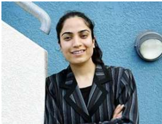
Malalai Joya, la més jove del Parlament de l'Afganistan