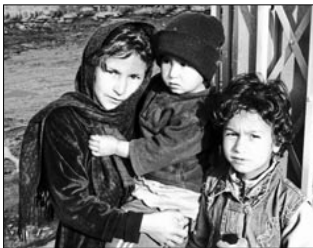
▲ Els nens sempre pateixen amb les guerres.

Aquesta participació és molt cara. En termes humans, fins ara, han mort 85 soldats de l'exèrcit espanyol destinats a l'Afganistan. En termes econòmics, l'Estat espanyol va gastar gairebé 240 milions d'euros —40 mil milions de les antigues pessetes— a la missió de la ISAF, només en els nou primers mesos de 2006.