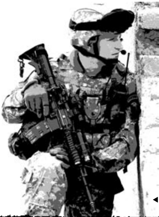
◀ Això és reconstrucció?

Part de l'explicació és que el govern imposat per l'ocupació inclou molts antics senyors de la guerra que comparteixen les actituds dels talibans respecte les dones.